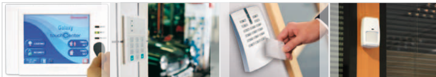
Galaxy® Dimension TouchCenter

Toonaangevende randapparatuur: met de nieuwste technologie